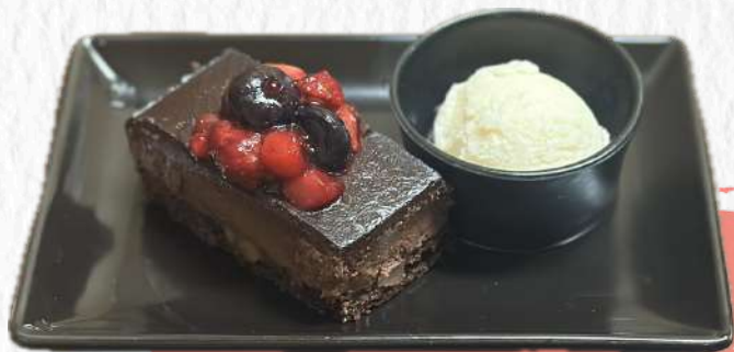
Chocolate mousse cake チョコレートムースケーキ ¥770