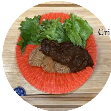
Crispy fried wheat gluten Kuruma-Fu Cutlet 車麩のカツ ¥ 1,320