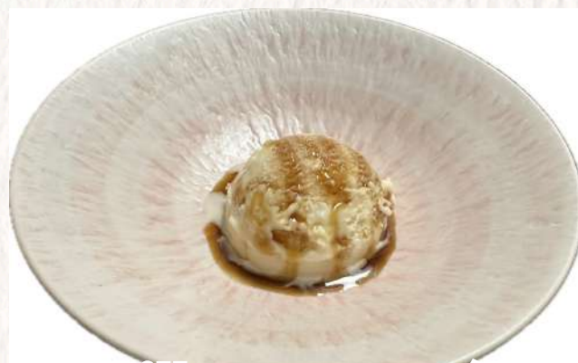
Soy Milk Ice Cream(Vanilla) 豆乳アイス(バニラ) ¥660