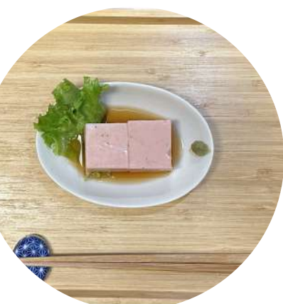
Sesame Tofu 胡麻豆腐 ¥ 660