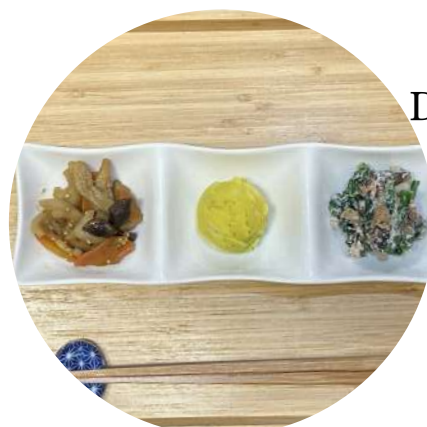
Daily Side Dish Trio 日替わり お惣菜 3 品 ¥ 770