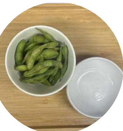
Edamame えだまめ ¥ 660