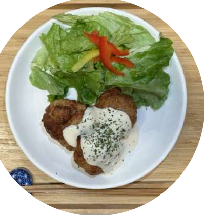
Soy meat Karaage 大豆ミート唐揚げ ¥ 1,320