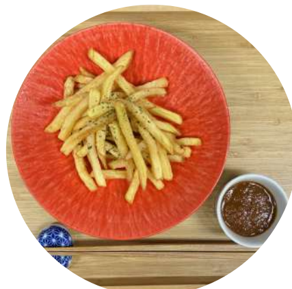
French Fries フライドポテト ¥ 660