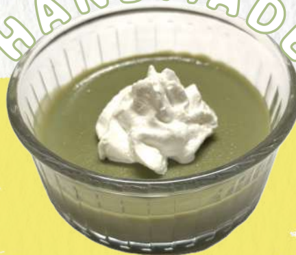
Matcha pudding 抹茶プリン ¥660