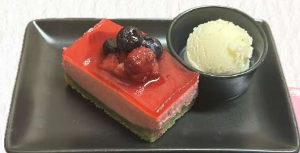
Berry mousse cake ベリームースケーキ ¥770