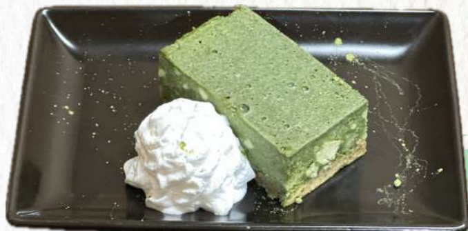
Matcha cheese-cake 抹茶チーズケーキ ¥770