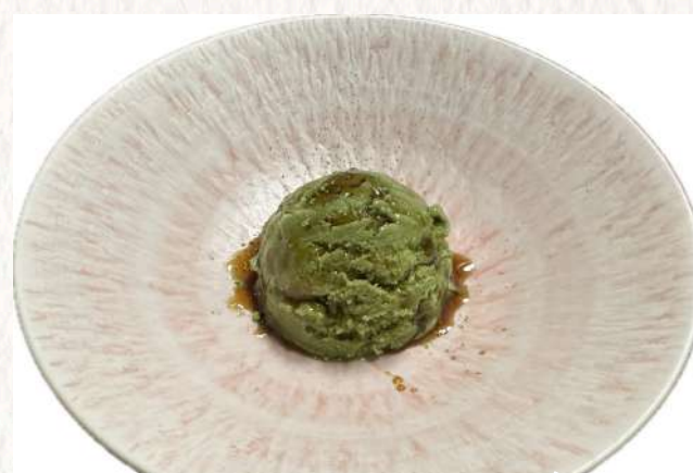
Soy Milk Ice Cream(Matcha) 豆乳アイス(抹茶) ¥660

※We do not use white sugar in our preparations. However, some desserts and condiments may contain white sugar as part of their ingredients. ※We do not provide coffee creamer at our establishment.